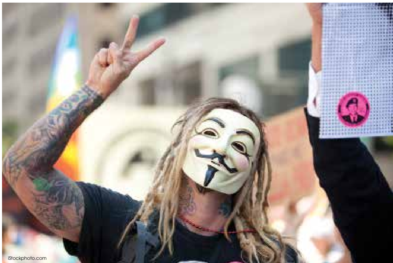
Demonstrant som protesterer mot arrestasjonen av Bradley Manning.

ikkje hadde blitt skapt for tretti år sidan. Politisk nepotisme har blitt praktisert til alle tider og av alle politiske retningar – det er noko alle har visst, tenk berre på utsegna «å ha partiboka i orden» – men det har blitt lettare å avsløre slike ting i dag, nettopp fordi teknologien har utvida grensene for kva som kan arkiverast. Wikilekkasjane rokkar også ved spørsmålet om arkivets autentisitet, ved sjølv det arkivale kjerneområdet. Ein av berejlkane i arkivvitskapen handlar om korleis autentiske arkivdokument skal skapast, bevarast og formidlast, og dette er samstundes eit hovudgrunnlag for arkivarprofesjonens identitet og legitimitet: Vi er til for å jobbe for at det blir skapt og bevart påliteleg arkivdokumentasjon. Etter Cablegate konstaterte ein debattant på det australske diskusjonsforumet at « the public exhibited absolutely zero interest in the authenticity and reliability of the WikiLeaks material... The assumption was that all the information was completely kosher » ( http://groups.google.com/