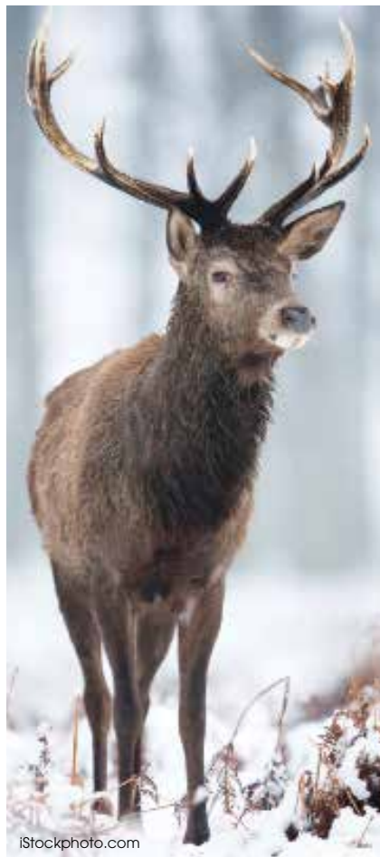
Denne hjorten har forhåpentligvis ikke møtt på Putin og Berlusconi i skogen.

I Norge fekk Aftenposten tilgang til heile Cablegate-databasen gjennom ein lekkasje frå WikiLeaks(!), og avisa har også publisert ein offentleg versjon der dei mest brukte orda og ei tidslinje kan gi tilgang