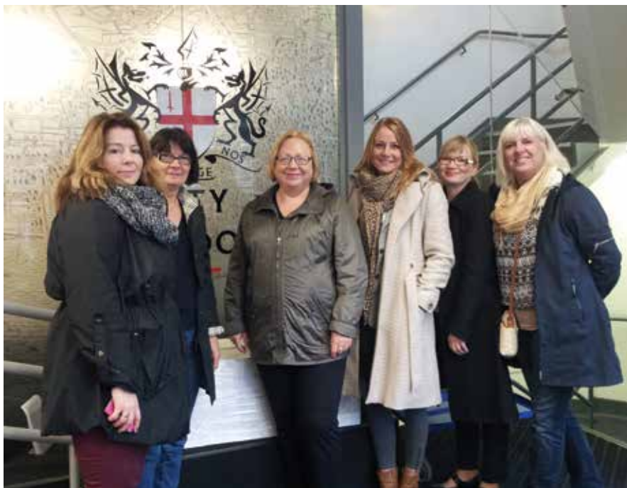
Tillitsvalgte på studiebesøk hos City of London.