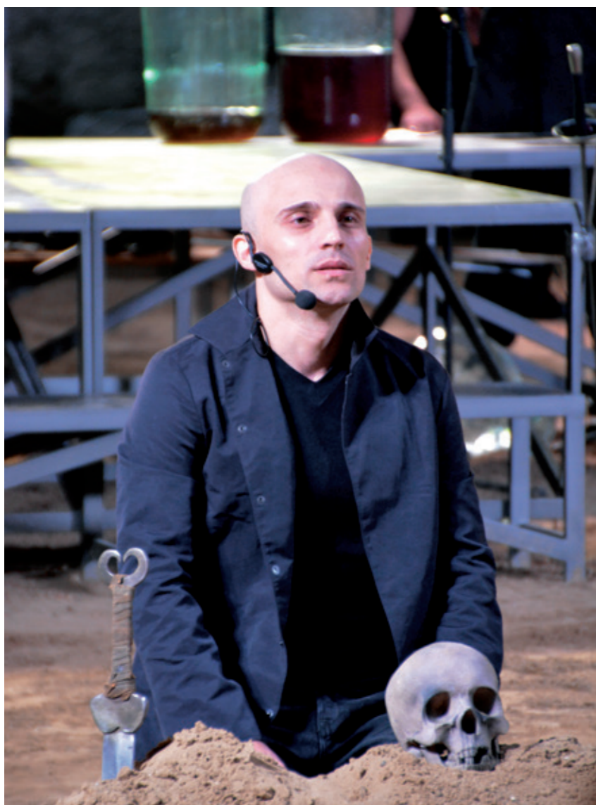
// Fange fra Rezina fengslet som spiller prins Hamlet. //

Justis- og beredskapsdepartementet opprettet i 2004 en beredskapsgruppe kalt Styrkebrønnen som består av ulike personer fra straffesaksjeden. Straffesaksjeden inkluderer blant annet forebygging, etterforskning, påtale, domstolsbehandling, straffgjennomføring og tilbakeføring til samfunnet. Oppdraget er å bidra med rådgivning og bistand til å bygge opp institusjoner som ledd i demokratiutviklingen i land hvor det har vært krig eller som er i en overgangsfase fra totalitære styresett til demokrati. Det dreier seg særlig om oppbygging av friomsorgen og innføring av alternative straffereaksjoner.