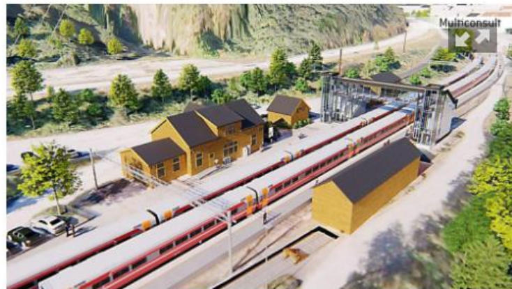
VIL HA BRU: Bane NOR vil ha overgangsbru mellom plattformene på Dale stasjon, slik illustrasjonen viser. Kommunen vil heller ha ein undergang mellom plattformene. Opninga i undergangen vil vera mot BKK, til høgre i illustrasjonen.

Vaksdal kommune og Bane Nor har vore i møte, utan å bli samde om korleis stasjonen skal sjå ut.